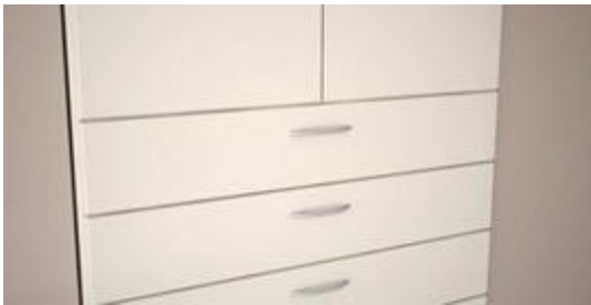
Tiroir avec façade en applique

Pour les tiroirs situés derrière des portes, une entretoise en plastique blanc (cale de distanciation) est intégrée. Ce type de tiroir convient à toutes les portes battantes et miroirs en applique, à l'exception des portes vitrées.