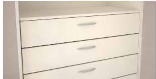
Tiroir avec façade en retrait